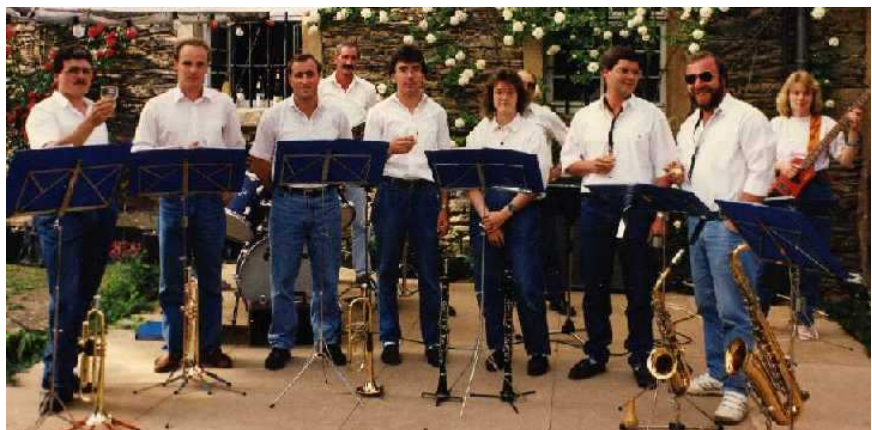
1993 im Schloss Wallhausen anlässlich Prinzessin Phillipa's Geburtstag

Es folgten viele weitere Auftritte des flotten Tanzorchesters, bevor es 1993 zum Erliegen der Aktivitäten kam. Nicht zuletzt konnte der zeitliche Aufwand von einigen Musikern nicht mehr gebracht werden.